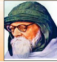
- विनोबा भावे

डर रखने से हम अपनी जिंदगी को बढ़ा तो नहीं सकते. डर रखने से बस इतना होता है कि हम ईश्वर को भूल जाते हैं, इंसायियत को भूल जाते हैं ऐसे देश को छोड़ देना चाहिए जहाँ धन तो है लेकिन सम्मान नहीं