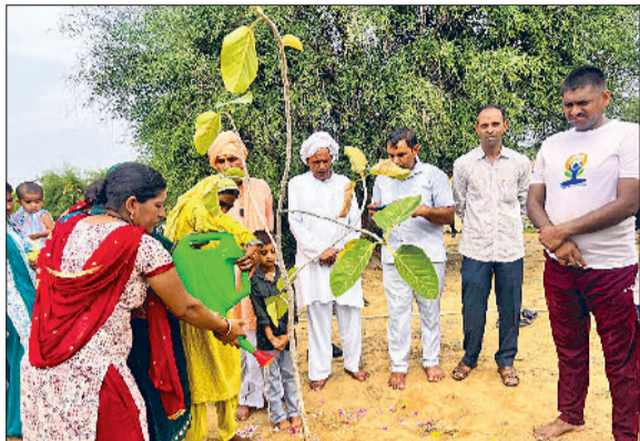
भिवानी। बरगद के पेड़ लगाते पर्यावरण प्रेमी।

ग्रामीणों ने ली रोपित पौधों के पेड़ बनने तक संरक्षण करने की जिम्मेदारी