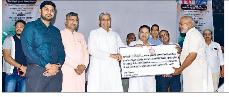
मिवानी। आयोजित कार्यक्रम में लाभार्थी को डॉक्यूमेंट देते हुए।

प्रदेश के वित्त मंत्री जेपी दलाल ने कहा कि सरकार अंत्योदय परिवारों के कल्याण एवं खुशहाली के लिए वचनबद्ध है और आदर्श समाज स्थापित करने के लिए प्रयासरत है। उन्होंने कहा कि ये गरीबों की सरकार है। नीति बनाकर गरीबों के हित में कार्य कर रही है। सरकार ने अपने कार्यकाल में अंत्योदय परिवारों को समाज की मुख्यधारा में लाने के लिए अनेक योजनाएं लागू की हैं। उन्होंने कहा कि गरीब परिवारों को पारदर्शिता से घर बैठे सरकार की योजनाओं का फायदा मिल रहा है। केंद्र सरकार से जो भी राशि मिलती है उसे डीबीटी के माध्यम से सीधा पात्र लाभार्थी के खाते में ट्रांसफर किया जाता है। विपक्ष ने कभी भी अंत्योदय परिवारों के लिए कोई कार्य नहीं